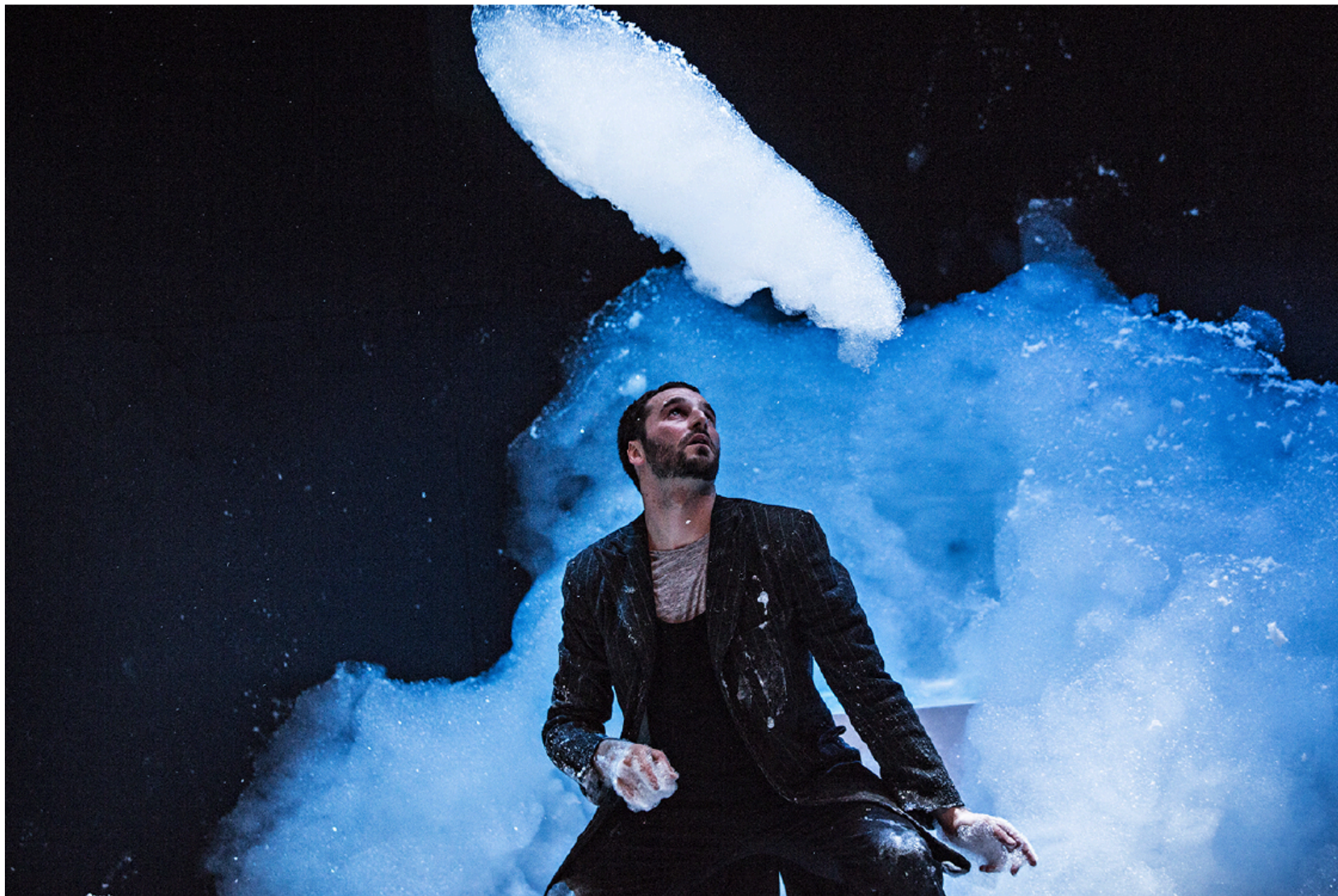
Théâtre de Romette - Le Petit Bain - 2