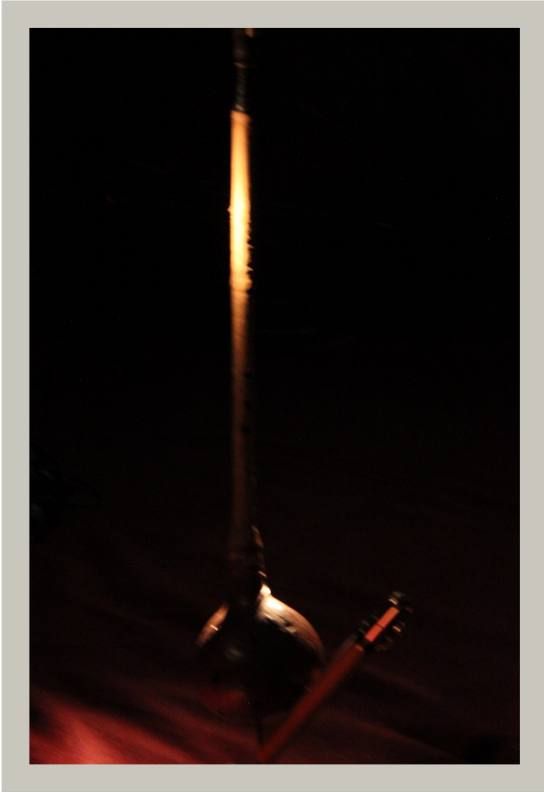
Clarigourde (fabrication personnelle)