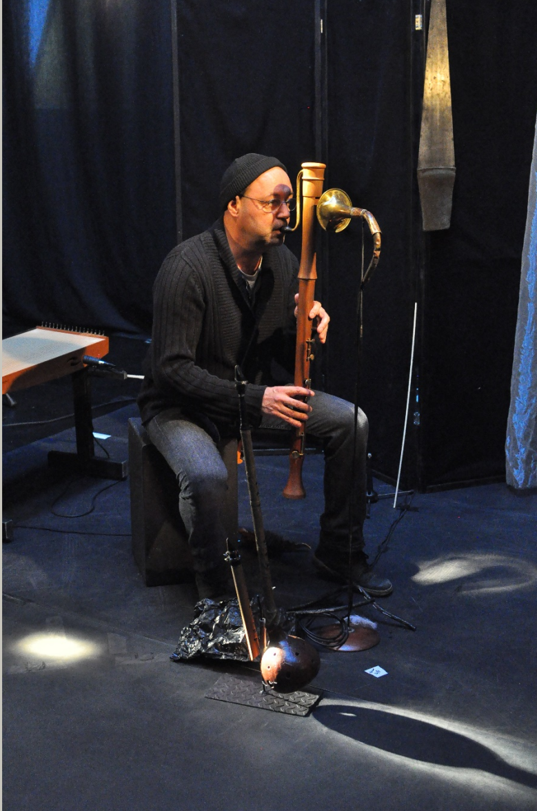
Flute à bec basse